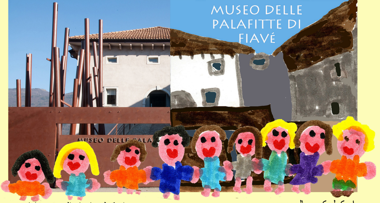
نرسری اسکول ماریا والے نتینی فیاوے